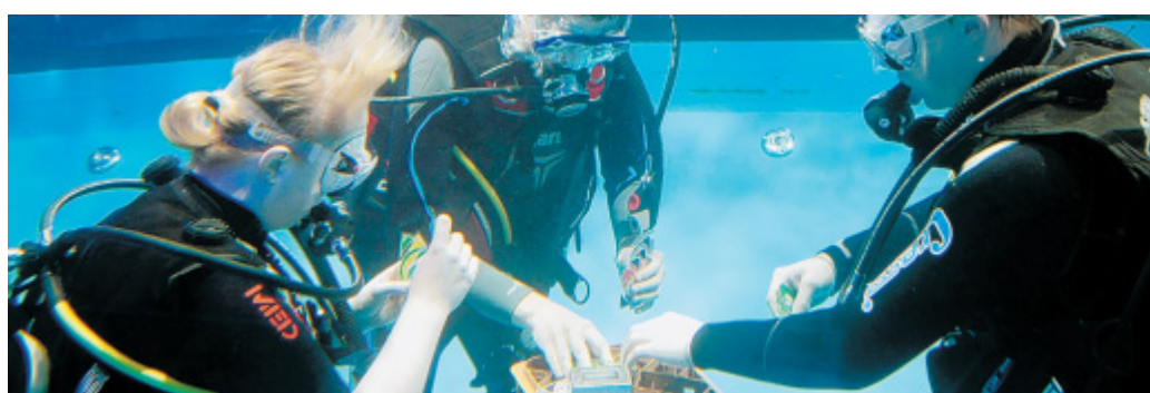
Unterwasser: Diese Taucher spielen in aller Ruhe Karten auf der boot.