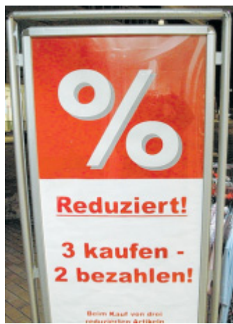
Rabattaktion: Drei Artikel kaufen, aber nur zwei bezahlen.

Eine weitere Art der Rabattaktion lautet zum Beispiel: „Drei kaufen - zwei bezahlen“. Dabei ist jeweils der günstigste von drei Artikeln umsonst. (hgm)