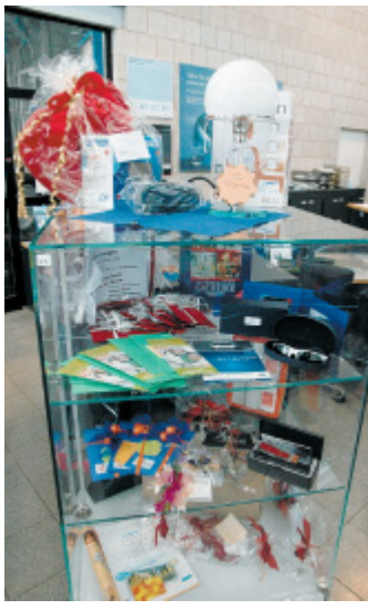
Was das Herz begehrt: 100 Preise warten auf Gewinner.

Als gemeinsame Basis haben sie die Gesellschaft bürgerlichen Rechtes „Benevia“ gegründet. Ziel des Zusammenschlusses sei nicht, Gewinne zu machen, sondern mit Messen wie der „Lebensart am Wiehen“ Wirtschaftsförderung zu betreiben. Überschüsse würden gespendet. Einen möglichen Überschuss