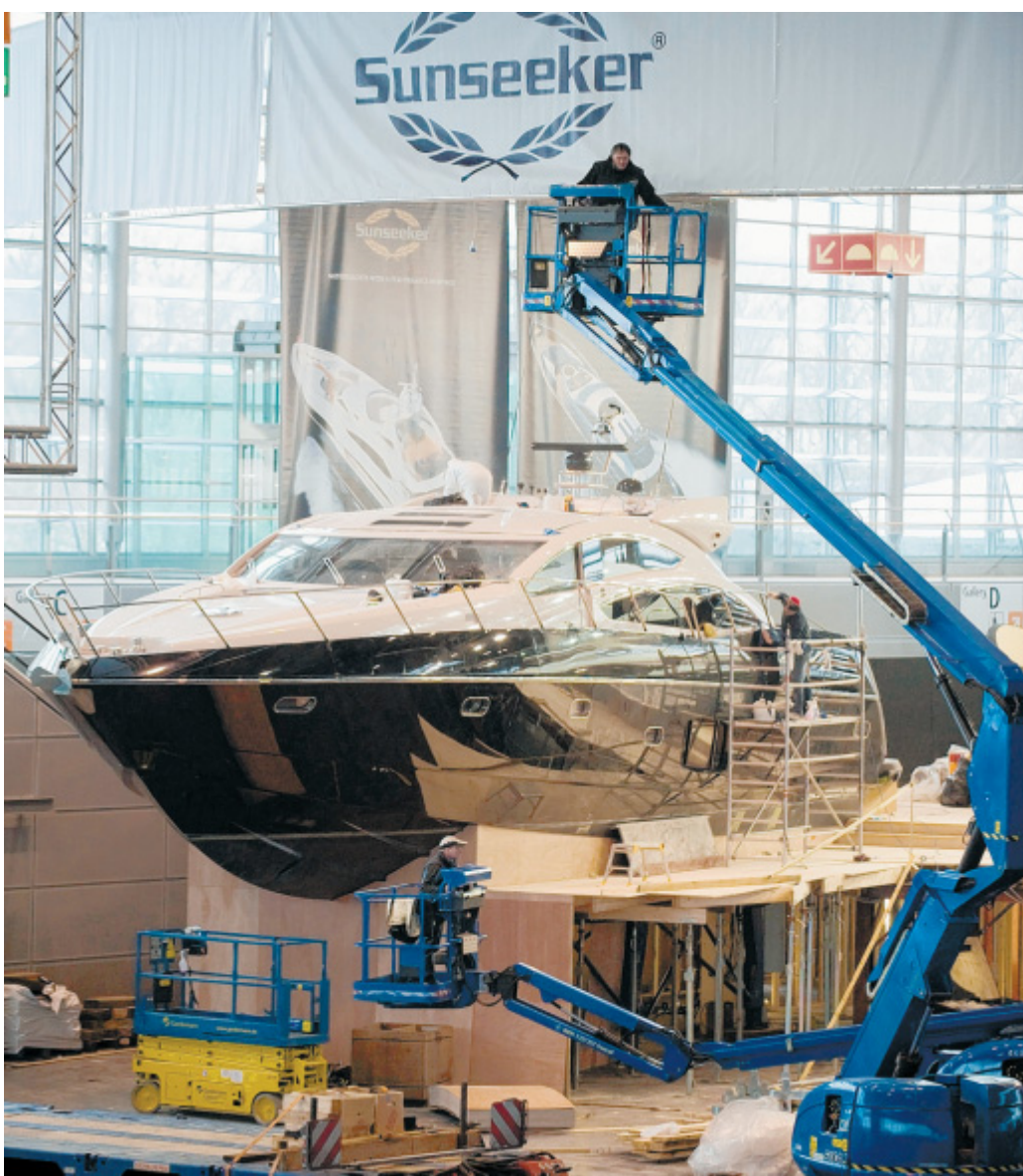
Kurz vor dem Messestart: In den Hallen werden die schönen Riesen der Meere aufgebockt.