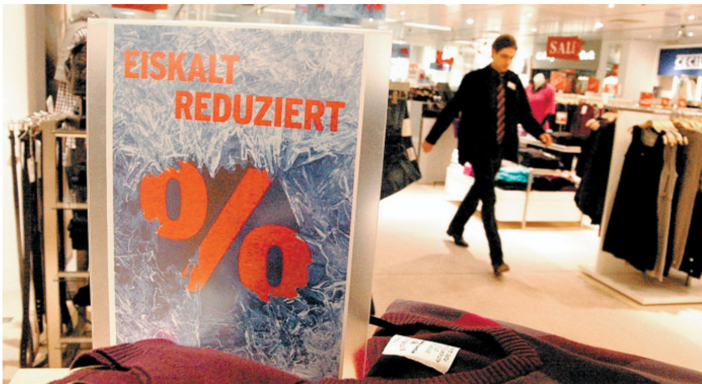
Prozente für den Kunden: „Eiskalt reduziert“, heißt ein Motto des Winter-Schluss-Verkaufes in einem Textilhaus mit attraktiven Rabatten für die Kundschaft.